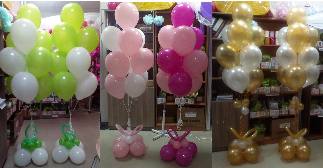
Фонтаны из 10 шаров на подставке в любой цветовой гамме